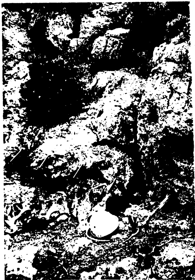
Vista de la angosta boca de entrada.