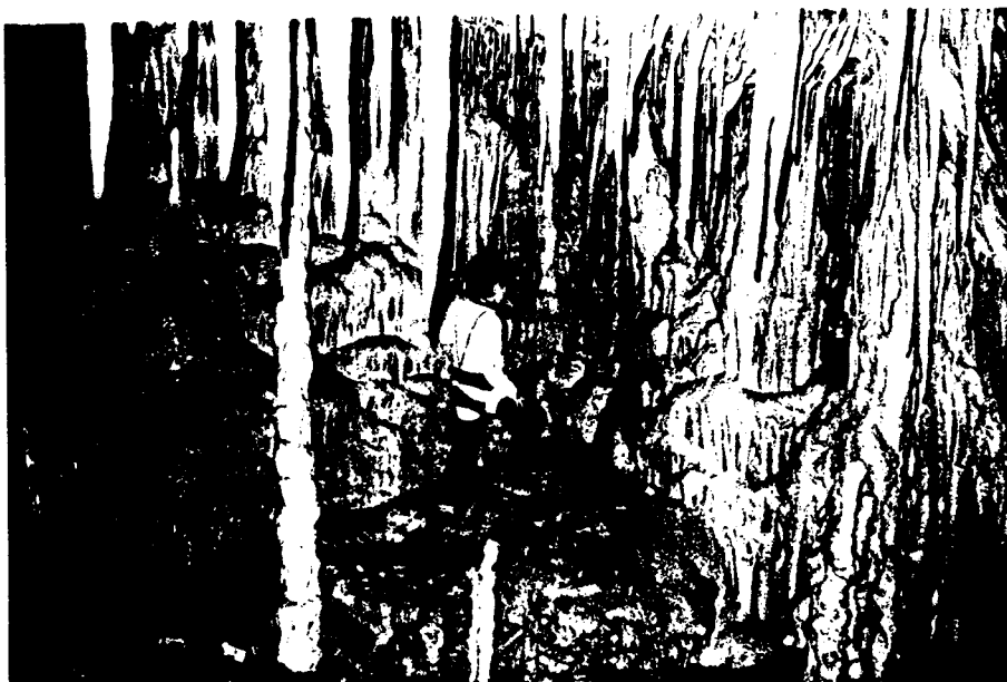
Aspecto de una de las salas.